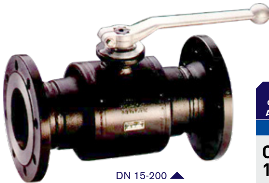
DN 15-200 ▲